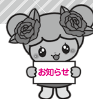
子育て世代包括支援センター

7月1日(日)に保健センターで「もうすぐパパママ教室」を行いました。この教室は4月に開設した「子育て世代包括支援センター」の新しい事業としてはじめてのものです。今回は妊娠後期(6ヶ月から9ヶ月)の妊婦さんとその家族の方 21組の参加がありました。