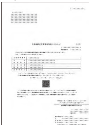
《資格情報のお知らせ》