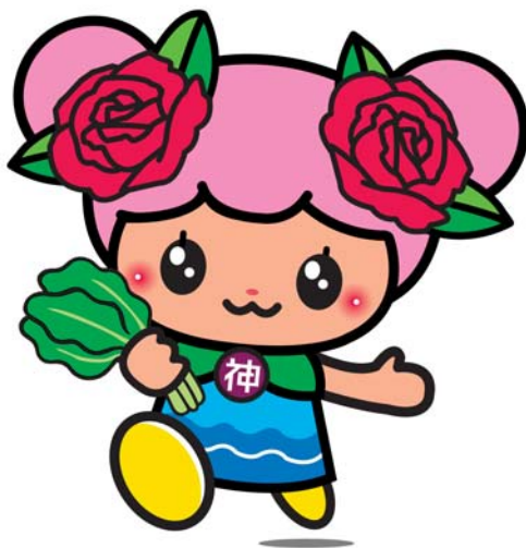
神戸町マスコットキャラクター 「ばら菜」