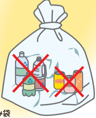
神戸市指定ごみ袋