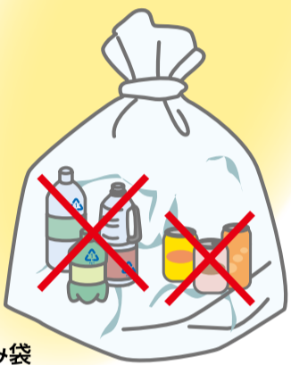
神戸町指定ごみ袋