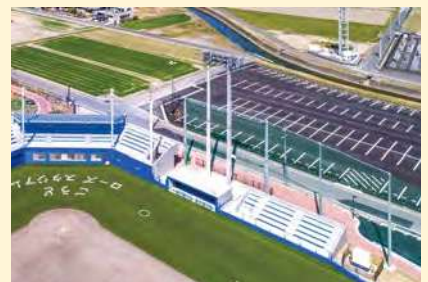
▲ローズスタジアム北側駐車場

9:20から約20分 間隔で、会場までの無料シャ トルバスを運行します のでご利用ください。