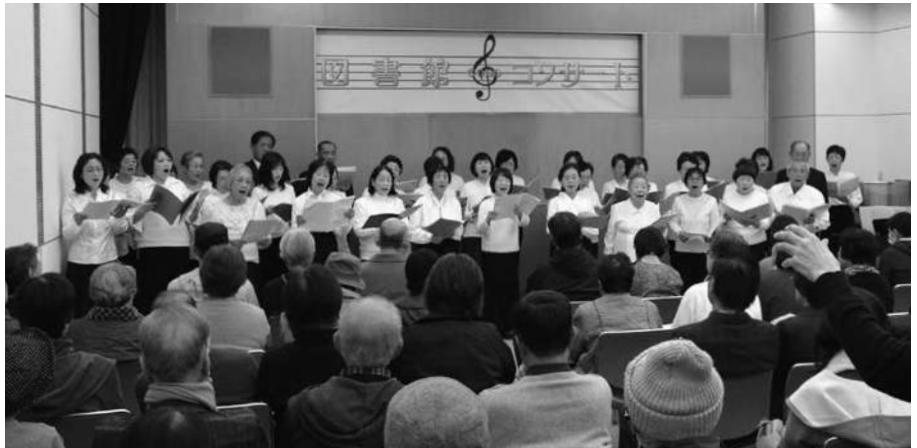
▲なかよしコーラス、仏様の歌を披露

コンサート終了後には、図書館芝生広場のイルミネーションが点灯し、参加者は幻想的な雰囲気も楽しみました。