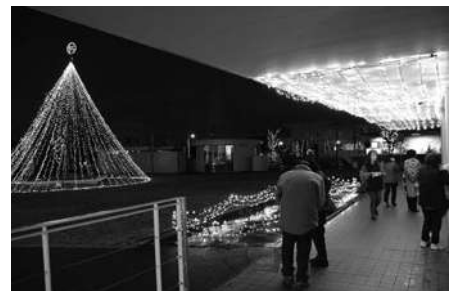
▲コンサート後のイルミネーション