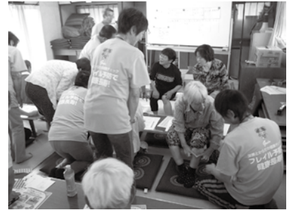
▲フレイルチェックの様子

町では、住民ボランティアである「フレイルサポーター」が活躍し、町内各地で「フレイルチェック」の取り組みを始めています。多くの地区から、フレイルチェックの要望をいただいておりますが、それにはもっと多くのサポーターが必要です。ぜひサポーターとして活動してみませんか？