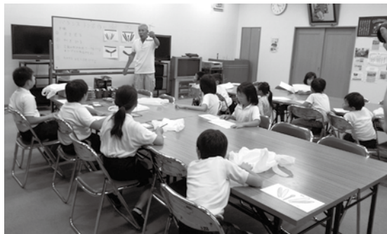
▲紙工作を楽しむ児童たち