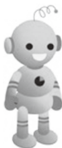
工業統計キャラクター コウちゃん

工業統計調査は我が国の工業の実態を明らかにすることを目的とした統計法に基づく報告義務がある重要な統計です。