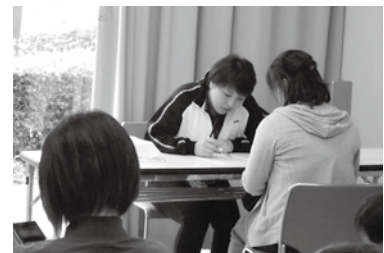
▲問診・血圧の様子