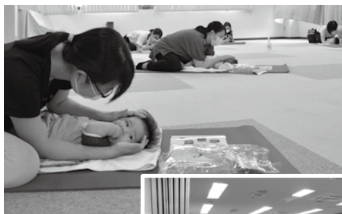
▲ベビーマッサージの様子

次回は9月15日(火)に開催します。対象の方には保健センターより案内をお送りします。