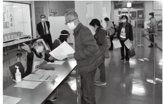
▲受付、検温、問診確認など

参加した医師は「シミュレーションを通して、いくつかの課題点が見えた。迅速かつ安全に接種するための体制を整える良い機会となった」と話されました。