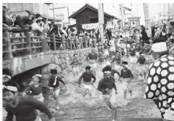
「走れ走れ」