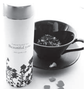
▲ 薔薇ティー(低糖専門キッチン源喜)