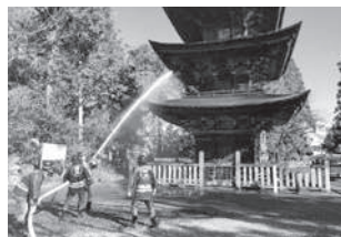
▲ 火災予防活動(日吉神社にて)

本年度より第1分団の分団長に任命されました。入団して7年目になります。団員として経験年数は短いですが、分団をまとめていきたいと思っております。