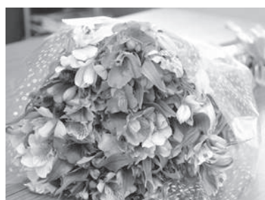
▲ アルストロメリアの花束 (岐阜アルストロメリア生産組合)