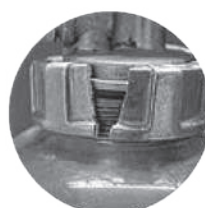
キャップ部分の破損・錆び