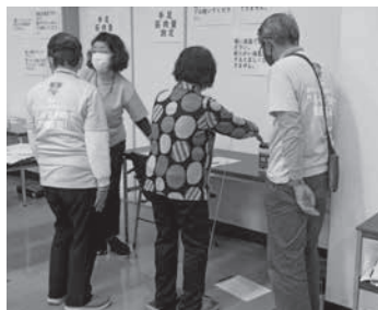
▲手足の筋肉量測定の様子

フレイルチェックは、体の状態を知ること、今の自分の健康状態を確認するきっかけになると同時に、弱っている部分について発見できる機会でもあります。参加者全員に、フレイル予防のポイントがつまった冊子を配布予定です。