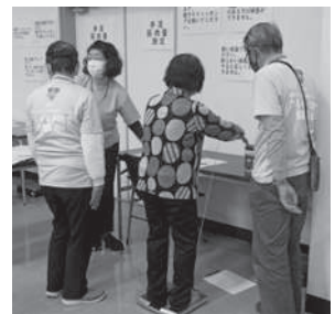
▲手足の筋肉量測定の様子

コロナ禍で活動機会が減ってしまい、「最近身体が弱くなった気がするな」「何かしなきゃと思うけれど、きっかけがない」と、自身の健康に関心のある方、新年を迎えたこの機会にフレイルチェック会に参加してみませんか。参加ご希望の方は、お電話等でお申込みください。