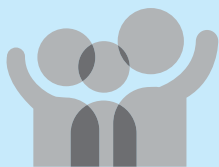
「家庭の日」シンボルマーク

「家庭の日」をきっかけにして、家庭の大切さや家族のあり方について見つめ直してみましよう。