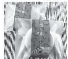
【お菓子処 平野屋】 涌泉郷