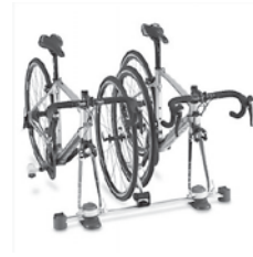
▲自転車車載器2台用 (株箕浦)