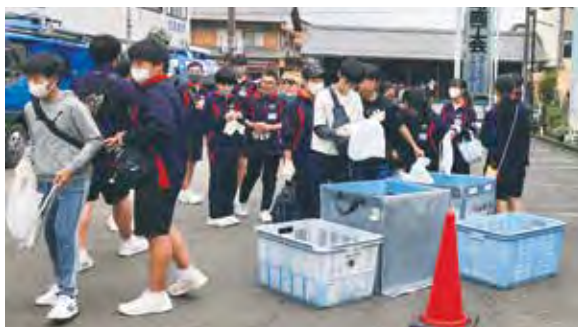
▲集めたごみは軽トラック1台分

今後も積極的に町で行われるイベントへ参加していくとのことですので、これからの活躍も期待しています。