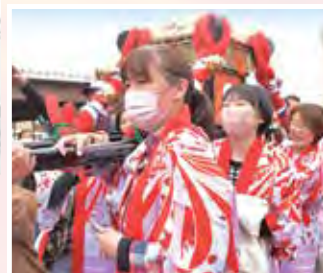
▲女性も一緒に神輿担ぎ

4年ぶりの開催となった神戸山王まつりを盛り上げるための新たなイベントとして、小学校1年生から4年生までの子どもたちが、ダンボールで作られた甲冑を着て通りを練り歩く「ダンボール武者甲冑行列」が開催されました。思い思いに色を塗ったダンボール甲冑の武者行列は、多くの方から注目を集めました。