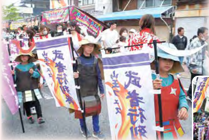
▲ダンボール武者甲冑行列