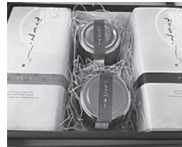
いちごバター (お菓子処 平野屋)