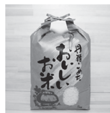
▲岐阜ハツシモ白米5kg (株若松農園)

ふるさと納税の専門サイトに商品を掲載します。全国への販路拡大と売上向上が期待できます。