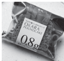
【低糖専門キッチン源喜】 パウンドケーキ (薔薇味)