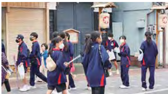
▲参加した中学生約130名