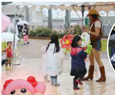
▲バルーンパフォーマンス

あいにくの雨の中での開催でしたが、町内生産組合による花卉の販売やキッチンカー、ワークショップなどが出店。園内のバラを解説するガーデンツアーも行われ、バラの魅力を感じていただくことができました。