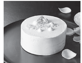
スノーホワイト (低糖専門キッチン源喜)