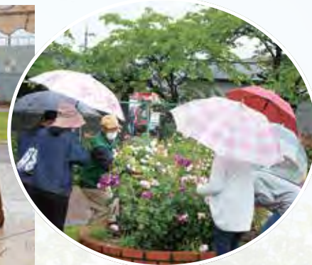
▲園内を解説するガーデンツアー