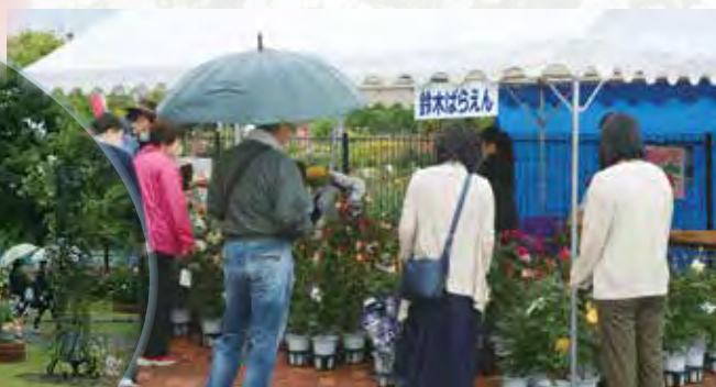
▲町内生産者による花卉販売