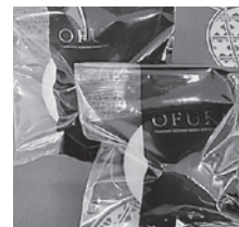
【お菓子処 平野屋】 OFUKU