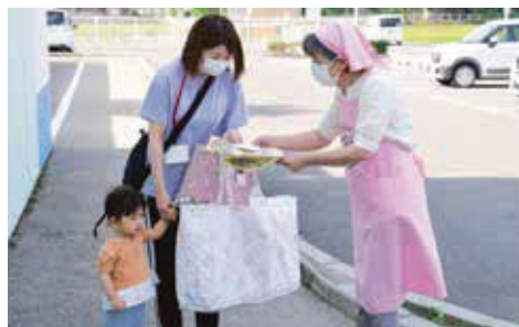
▲幼稚園にて食育リーフレットの配布