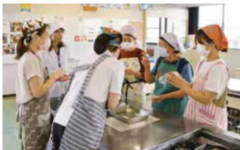
▲おやつ教室で調理のアドバイス

協議会では、新しくメンバーになってくれる方を募集しています。保健センターで開催されるヘルスマイトスクールに参加した方が対象になりますので、興味のある方は参加してみてくださいはいかがでしょうか。あなたの考えたレシピが町民の皆さんの食生活向上の一助となるかもしれません。