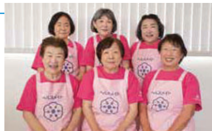
▲神戸町食生活改善協議会の役員の方々

保健センターで開催している「離乳食教室」や「おやつ教室」では、実際の調理やアドバイスを行っています。1歳から就学前の子どもの保護者を対象に開催され、地産地消の野菜を使用した健康的なメニューを考え、調理を実際に見ていただくことで、より分かりやすく人気となっています。また町内の幼稚園や小学校、中学校には、リーフレットなどを配布し、健康な食生活や食の大切さを伝える活動など行っています。