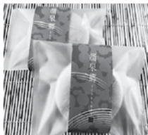
【お菓子処 平野屋】 涌泉郷