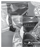
【お菓子処 平野屋】 OFUKU