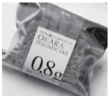
【低糖専門キッチン源喜】 パウンドケーキ(薔薇味)