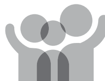
「家庭の日」シンボルマーク

これらのことを家庭や地域が再認識し、「心豊かで明るい家庭」づくりを進めることが望まれています。「家庭の日」をきっかけにして、家庭の大切さや家族のあり方について見つめ直してみましよう。