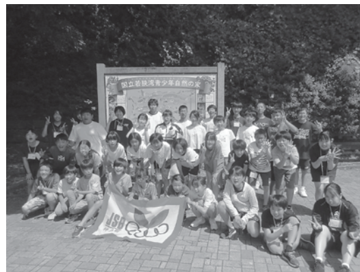
▲SUMMER キャンプ (6年生対象)

※小学校新1年生以上の入団募集を行っています。(ただし、新3年生以上の募集となる単位団もあります。)