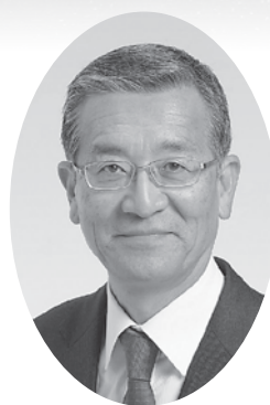
神戸町長 藤井 弘之

我が国の経済状況につきましても、このところ一部に足踏みもみられるもののコロナ禍の3年間を乗り越え、緩やかに改善しつつあります。