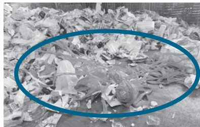
▲梱包材等、事業で使用した物は産業廃棄物へ

資源ごみとして収集しているプラスチック製容器包装の収集かごに、異なるものが混在している事案が多く発生しています。リサイクル推進のため、正しい分別にご協力をよろしくお願いいたします。