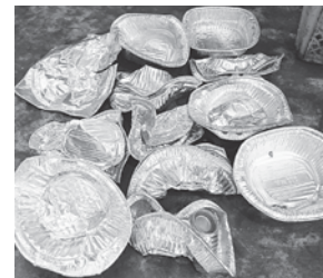
▲アルミ製品（鍋焼きうどん容器等）は不燃ゴミへ