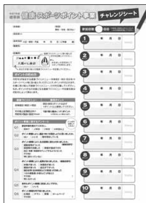
▲チャレンジシート