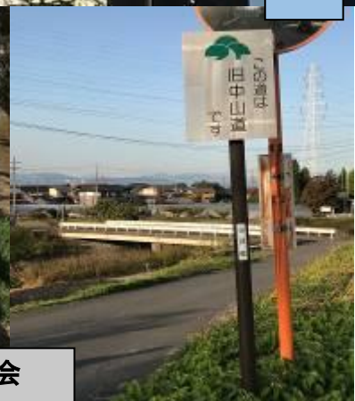
神戸町観光ボランティアガイドの会