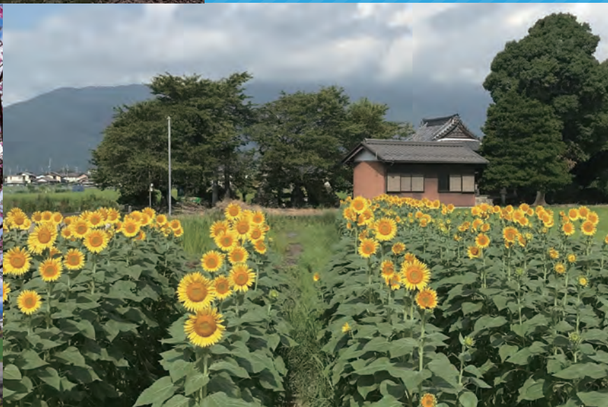
過去の受賞作品の一部

令和7年度版の「神戸町くらしのカレンダー」の各月ページに掲載する写真を募集します! 神戸町の日々の風景や情景など、 神戸町の良さを伝える写真 をお待ちしています。