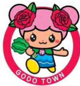
神戸町公式マスコットキャラクター ばら菜