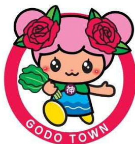
神戸町公式マスコットキャラクター ばら菜