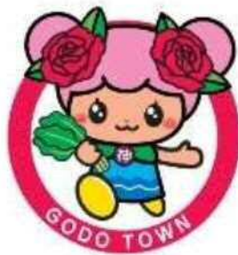
神戸町公式マスコットキャラクター ばら菜