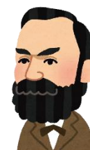
アルフレッド・ノーベル

大展示 …… 「世界絵本賞」 ミニ展示 …… 「2020 ノーベル賞」 第74回 読書週間 ～ 11/9まで