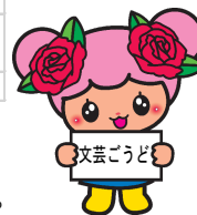
神戸町マスコットキャラクター ぼら葉